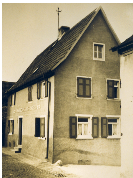
Zum Kleinen Tribunal, älteste Gaststätte Heidesheims.

Ihre Namen verraten uns die liebevolle Vertrautheit der Heidesheimer zu ihren Kneipen (Zum Bettche/Zum Stolpereck). Sie belegen ihre Neigung zu Spöttelei und Ironie (Gasthaus "Zur schönen Frau"). Schon der Name "Zum Kleinen Tribunal" verweist auf die historische Rolle der Oberdorfkneipe als wichtige Klatsch- und Nachrichtenbörse im Ort, die sich als "erste Sängerkneipe" in Heidesheim großer Beliebtheit erfreute.